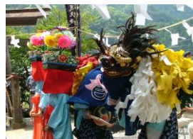
芦ヶ久保の獅子舞