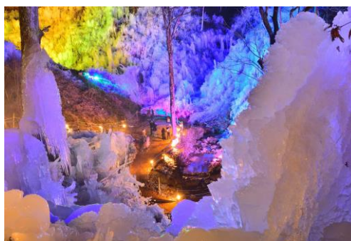
あしがくぼの氷柱(ライトアップ) ※写真は、過去のものです。