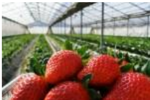
いちご狩り (イメージ)