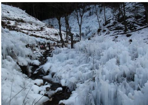
あしがくぼの氷柱(日中)