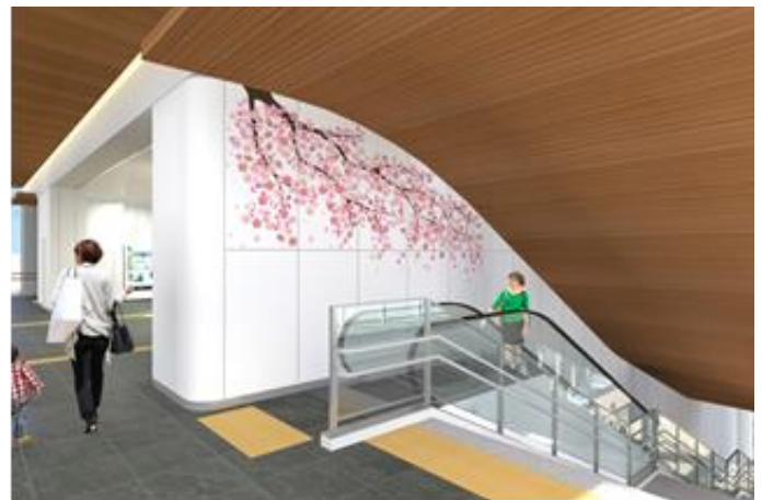
自由通路内メモリアルアート(イメージ)