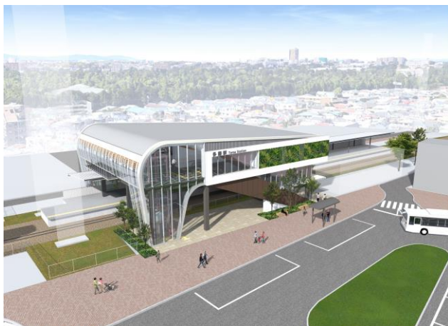
東口外観(イメージ)