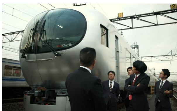
社員出演シーンの一部