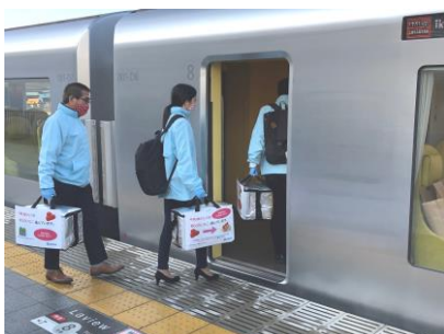
輸送イメージ(参考:実証実験第2弾の様子)