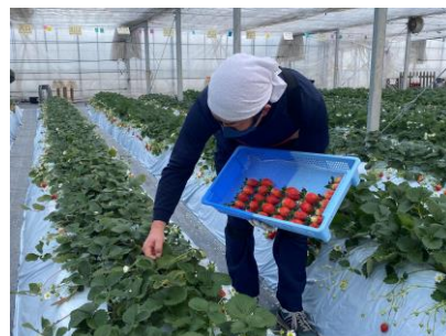
収穫(参考:実証実験第2弾の様子)