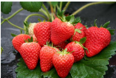
秩父地域産の“いちご”