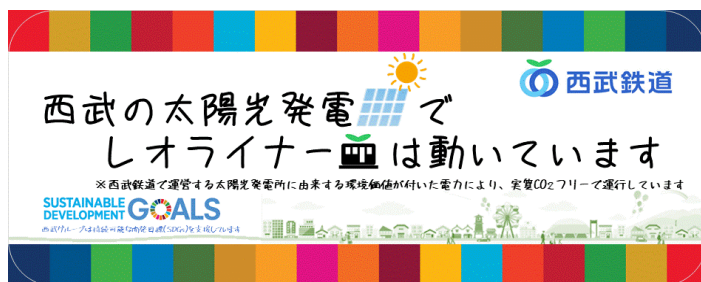
ステッカーイメージ