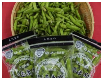
川越・狭山地域等の“枝豆”と“とうもろこし”