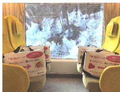
輸送イメージ(参考:昨年度の実証実験の様子)