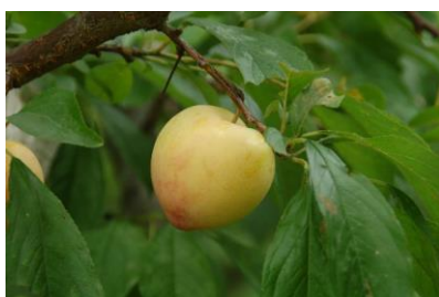
横瀬町あしがくぼ産の“プラム”