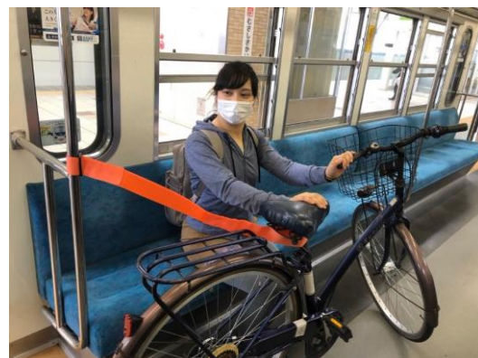
車内利用イメージ