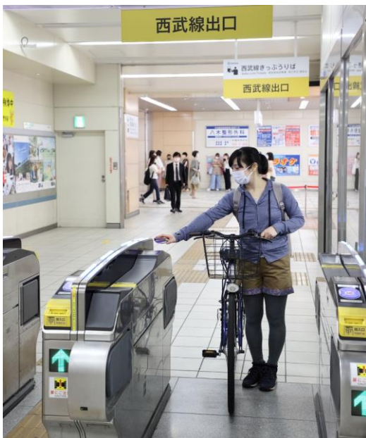
改札通過イメージ