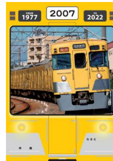
「2000 系オリジナルノート」イメージ