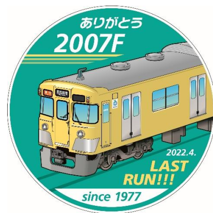
引退記念ヘッドマーク・ステッカーデザイン