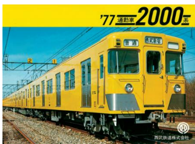
「2000系パンフレット[復刻版]」イメージ