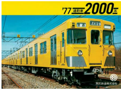
「2000 系パンフレット[復刻版]」イメージ

(記念乗車証・2000 系パンフレット[復刻版]・2000 系オリジナルノート・2007編成のつり革・鉄道部品) ※つり革の種類はお選びいただけません。