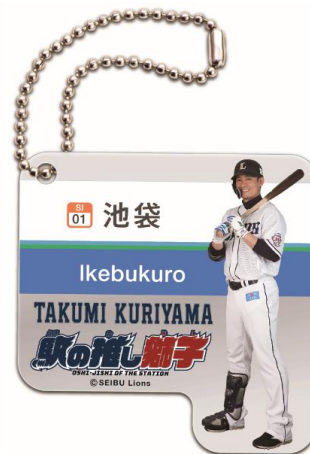
駅の推し獅子 BIG キーホルダー (非売品)