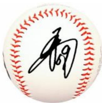
選手直筆サイン入りボール