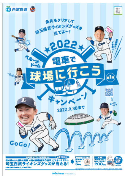
ポスターデザイン

※西武線沿線の観光地等へおでかけの際に特定の条件で西武線に乗車するとポイントが貯まるサービス