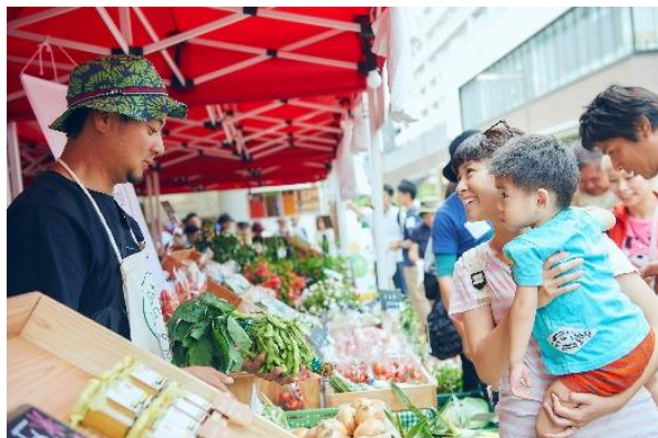
以前の開催の様子

※新型コロナウイルス感染症の感染拡大の状況によっては、企画のすべてまたは一部に中止・変更が生じる可能性があります。