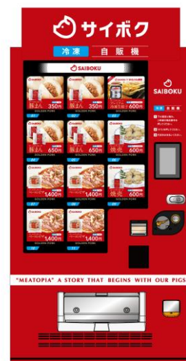
冷凍自動販売機 (イメージ)