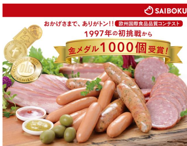
サイボク自社工場で製造された「ハム・ソーセージ」 (イメージ)