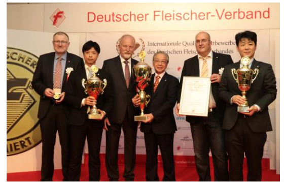
DFV ドイツ食肉連合会 ハム・ソーセージコンテスト 【ハム・ソーセージチャンピオン杯受賞】の際の様子

大自然豊かな牧場でサイボクが認めた優秀な血統の種豚を掛け合わせて誕生したのが「ゴールデンポーク」。ゴールデンポークを原料にしたハム・ソーセージなどは国際的にも高い評価を受けております。