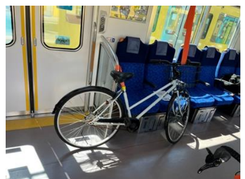
車両への固定(イメージ)