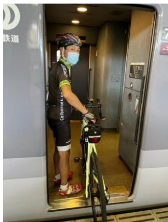
車両への搬入出(イメージ)