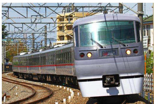
〈新宿線〉 10000系(特急レッドアロー号)