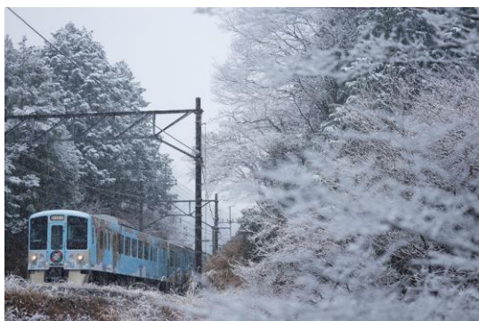
西武 旅するレストラン「52席の至福」

※新型コロナウイルス感染症の感染拡大の状況によっては、企画のすべてまたは一部の中止・変更が生じる可能性があります。