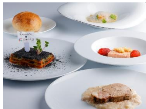
提供料理(イメージ)