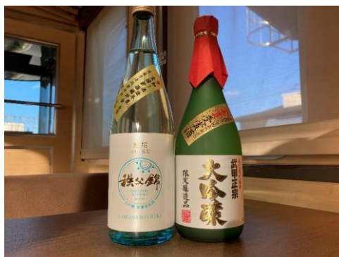
秩父のおススメ日本酒(イメージ)