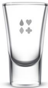
「52席の至福」冷酒グラス(イメージ)

【旅行代金に含まれるもの】 乗車チケット(西武線1日フリーきっぷ)、お食事代、諸税 お土産(冷酒グラス)、ふるまい酒、ワンドリンク(秩父のお酒)