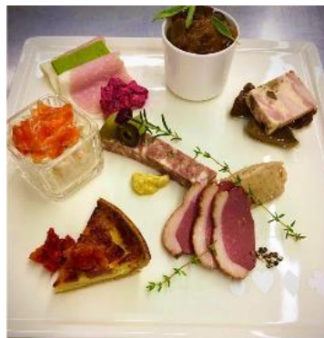
提供料理(イメージ)