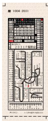
車内補充券(レプリカ)イメージ