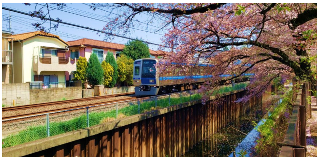
石神井川沿いの電車と桜