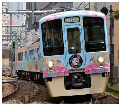
西武 旅するレストラン「52席の至福」