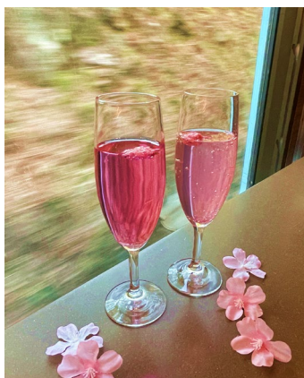
桜をイメージしたウエルカムドリンク