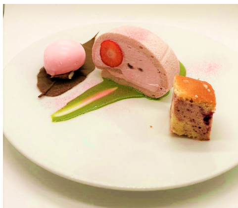
特別デザート(イメージ)