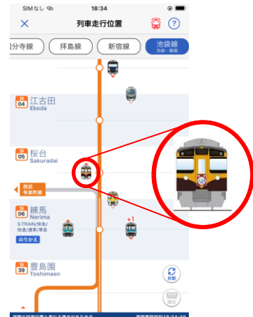
「西武線アプリ」表示イメージ

https://www.seibuapp.jp/railways/seibulineapp/