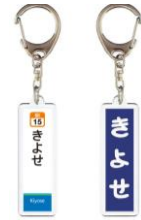
オリジナル駅名標 アクリルキーホルダー