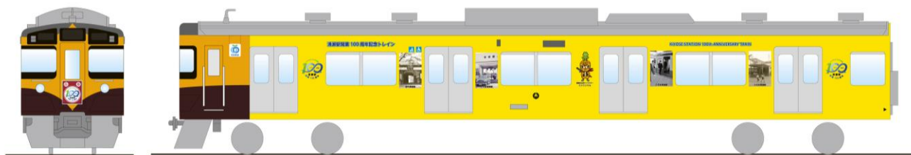
ラッピング車両（デザインイメージ）