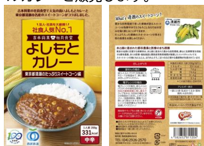
商品パッケージ(デザインイメージ)