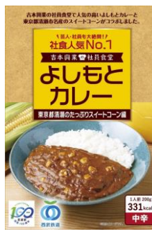
よしもとカレー 「東京都清瀬のたっぴりスイートコーン編」