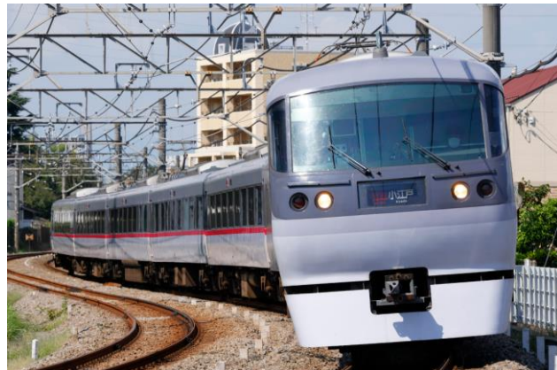
「NRAで行く新宿線&支線大冒険ツアー」 10000系（ニューレッドアロー）