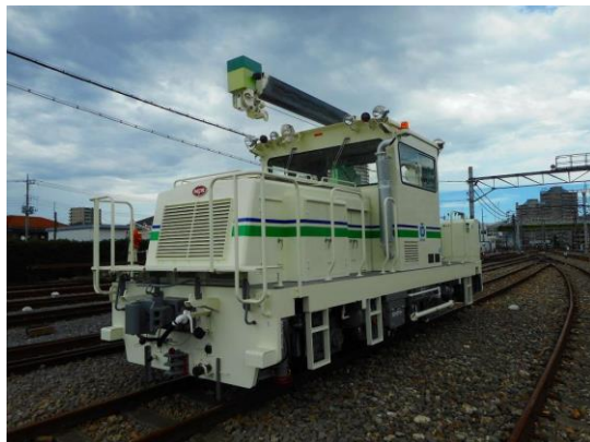
「鉄道のお仕事体験&保守用車乗車体験ツアー」 体験乗車ができるモーターカー