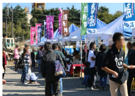
2019年横瀬車両基地でのイベント風景