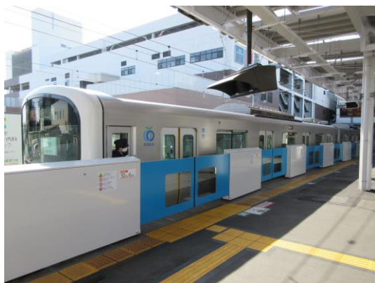
ホームドア イメージ（所沢駅）