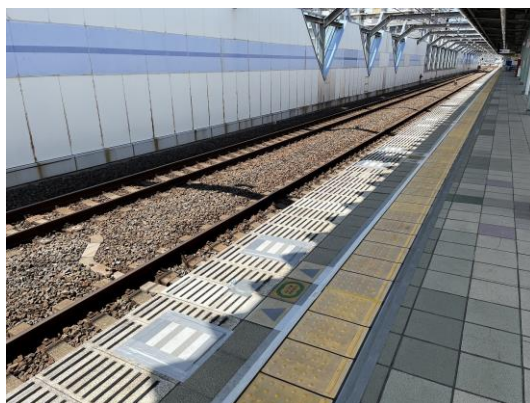
練馬高野台駅1番ホームの現況