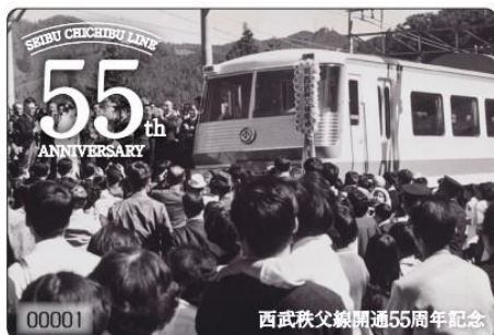
記念乗車券イメージ