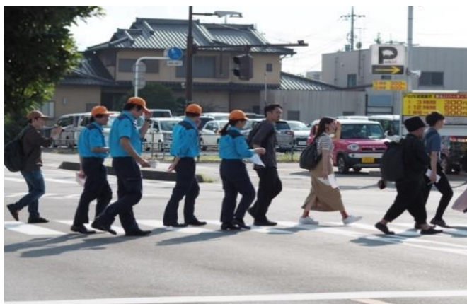
アーティストによるフィールドワークの様子