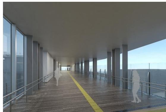
自由通路内（イメージ）