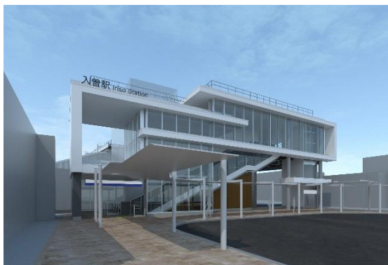
東口外観（イメージ）