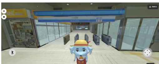
江古田メタバース