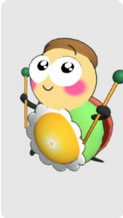
早川 ひなのさん作