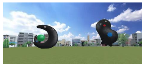
学生が考案した江古田のまち