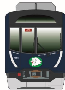
アイコンイメージ