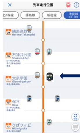
「列車走行位置」ページ画面