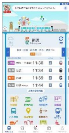
西武線アプリ ホーム画面

※「西武線アプリ」の詳細はこちら https://www.seibuapp.jp/railways/seibulineapp/