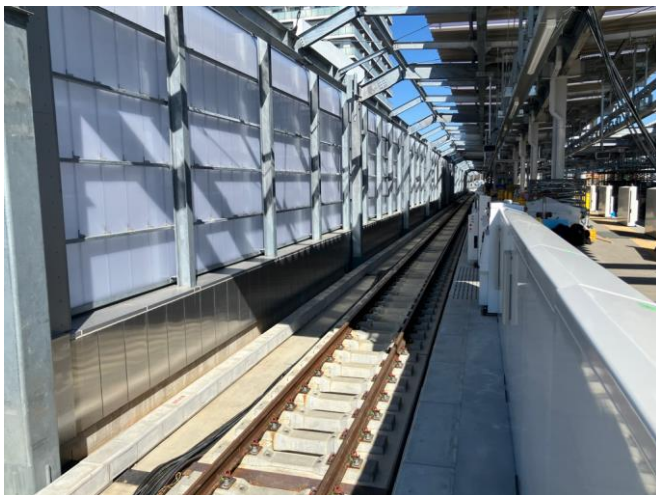
新しい東村山駅の高架ホームの線路