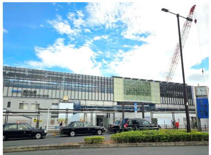
東村山駅西口ロータリーからの駅部状況