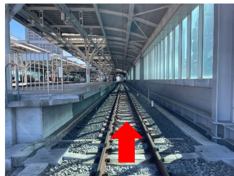
高架上歩行コース