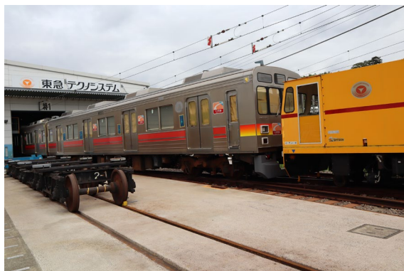
車両搬送の様子（10月9日撮影）