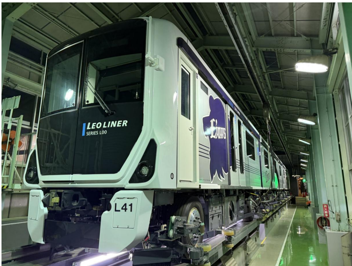
新型レオライナーL00系 第1編成