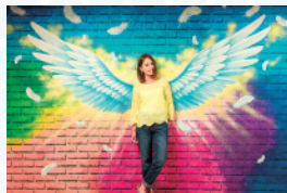
「エンジェルウイング」

横浜大世界内の4~8階の5フロアで常設展示している 中華街の人気ミュージアム。飛び出して見える絵画 や、写真を撮るとまるで自分が絵の中に入り込んで 見える作品、シアター等錯視錯覚の不思議な空間が体 験できます。