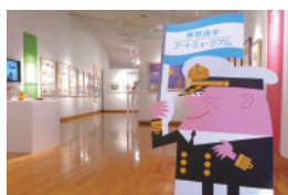
柳原良平アートミュージアム

帆船日本丸・横浜みなと博物館 みなとみらい線 みなとみらい駅5番口または馬車道駅2番口から 徒歩5分