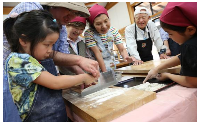
“そば打ち”を体験できる「道の駅果樹公園あしがくぼ」