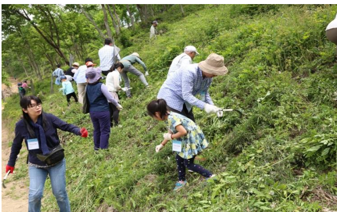
第 1 回環境活動で除草作業した「花咲山（仮称）」