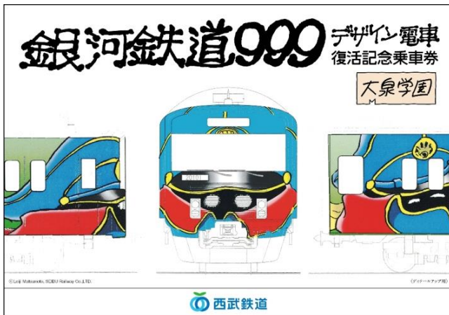
「大泉学園版」台紙（表紙）