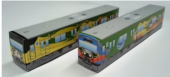
ペーパークラフト 完成イメージ

一般発売：おひとりさま各2セットまでの発売（購入者特典はありません） ・通常版・大泉学園版のセット販売ではありません。