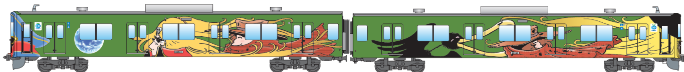
「銀河鉄道999デザイン電車」(左:1号車、右:8号車) ※イメージ

©Leiji Matsumoto, SEIBU Railway Co.,LTD.