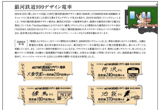
「通常版」台紙 (中面・乗車券セット)