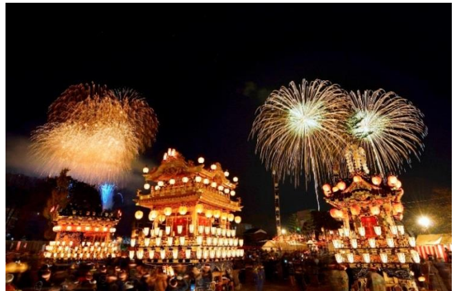
秩父夜祭の勇壮な笠鉦・屋台と冬の夜空に煌く火花

屋台両袖に舞台を特設しての地芝居(秩父歌舞伎)や地元の花柳一門と杵屋一門によるひき踊りは、秩父神社神楽とともに「秩父祭りの屋台行事と神楽」として国指定重要無形民俗文化財となっています。