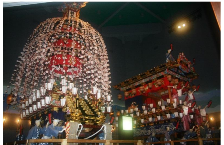
“秩父夜祭”を体感できる「秩父まつり会館」