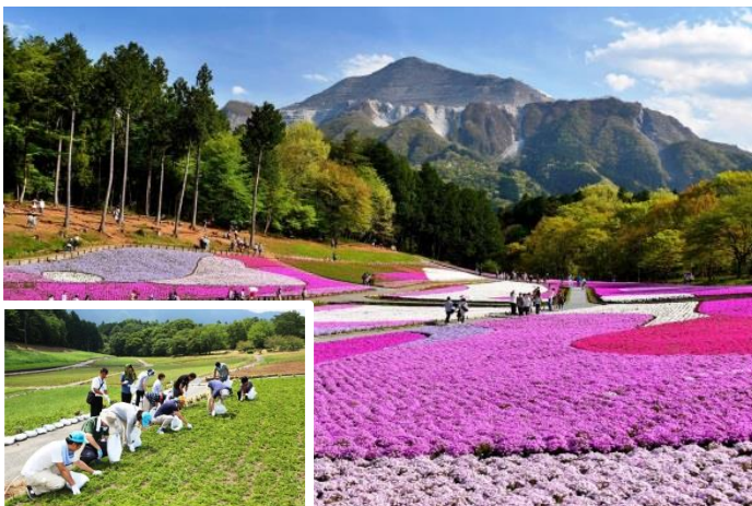
第 2 回環境活動で除草作業した「羊山公園」