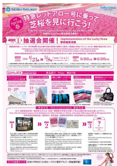
キャンペーンチラシ