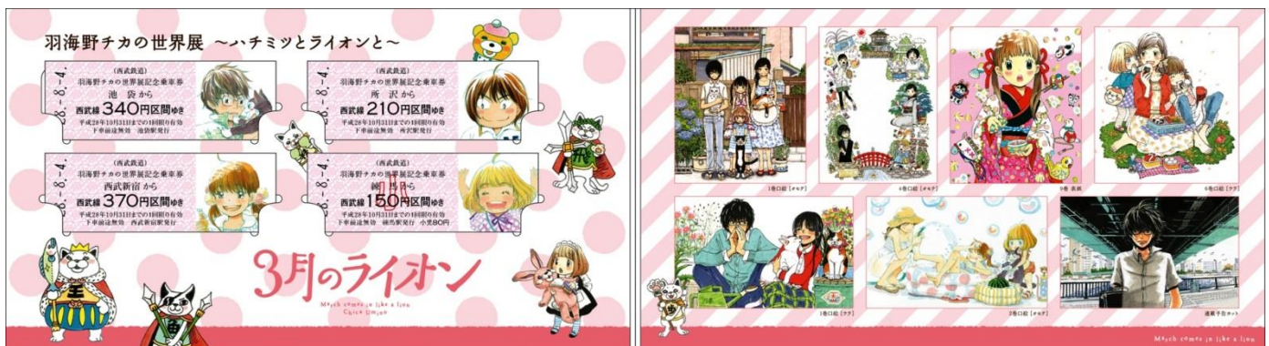
「羽海野チカの世界展～ハチミツとライオンと～」記念乗車券（オリジナル台紙：展開）