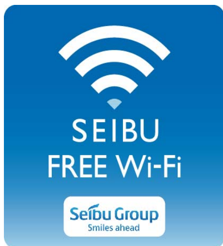
「SEIBU FREE Wi-Fi」ロゴ