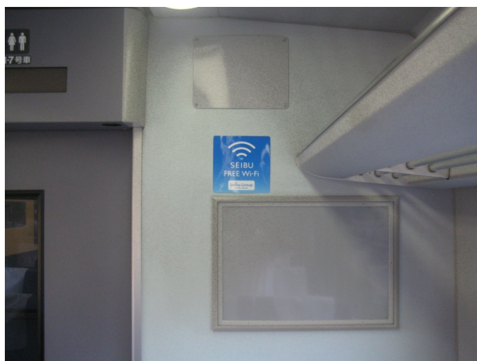
ステッカー掲出イメージ