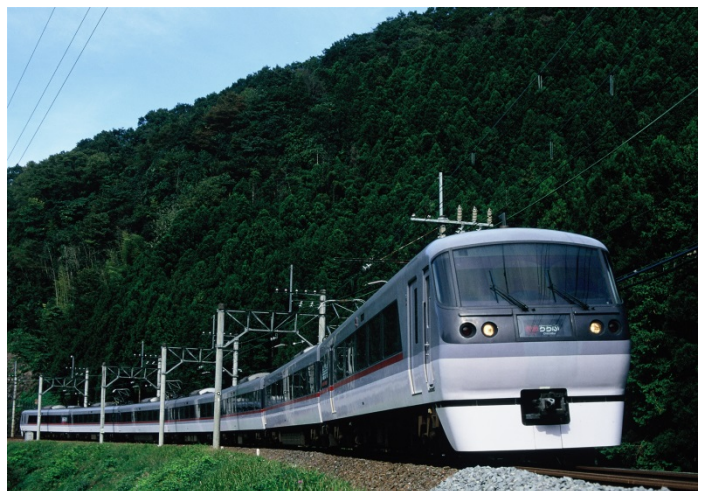
特急レッドアロー号

* 「SEIBU FREE Wi-Fi」とは 提供エリア内でスマートフォン等の通信端末を利用し、6言語（英語・中国語[繁体字・簡体字]・タイ語・韓国語・日本語）に対応した「SEIBU FREE Wi-Fi」専用ページから、メールアドレスをご登録いただくだけで、簡単にインターネットに接続いただけます。