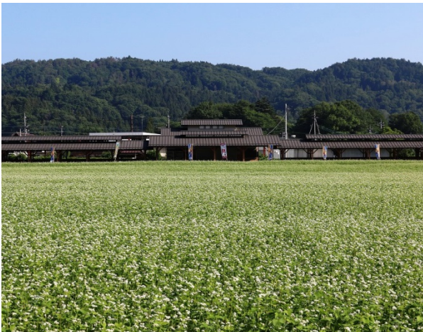
毎年5・9月にそばの花が咲き誇る 「ちちぶ花見の里」