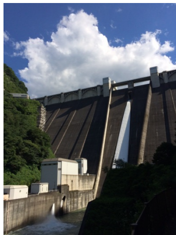
『浦山ダム防災資料館うららびあ』やダム内部の見学ができる 「秩父さくら湖（浦山ダム）」