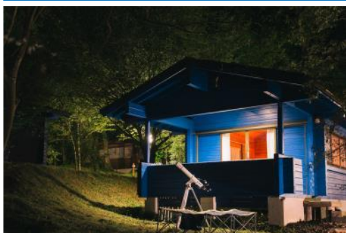
▲PICA 秩父「コテージ・星ぞらキャンプスタイル（定員6名）」

・一般のお客さまと異なる車両をご用意予定。車内でお子さまがはしゃいでも安心！退屈させない催し物も！