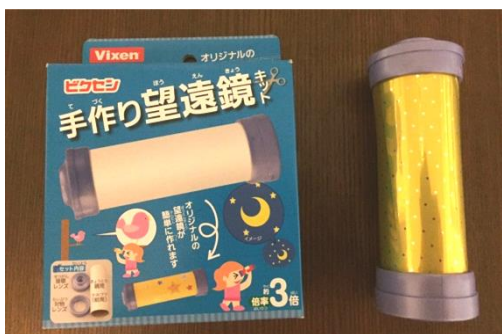
▲手作り望遠鏡キット