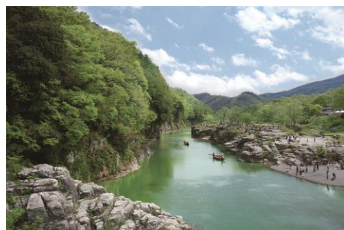
▲長瀨・岩畳 ※本リリースの画像は全てイメージです。