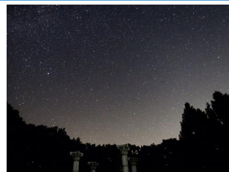
▲秩父ミュージックパークの星空