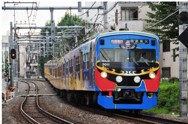
引退した初代「銀河鉄道999デザイン電車」