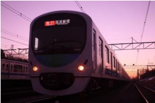
▲西武鉄道 30000系・スマイルトレイン (使用車両は未定・事前に公開はしません。)