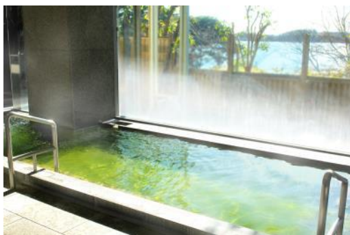
▲中国割烹旅館 掬水亭「狭山の茶湯」