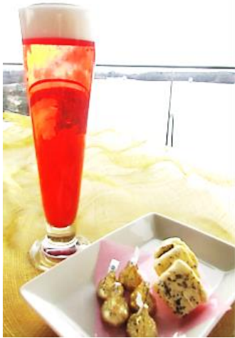
▲飲食プラン『赤富士・サンセット』