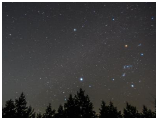
冬の星空(オリオン座など)

速達性 「プレミアムフライデー号」急行 西武遊園地行を臨時運転! “西武新宿から直通 45分”