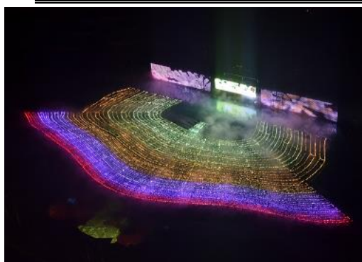
▲大海原のマッピング劇場