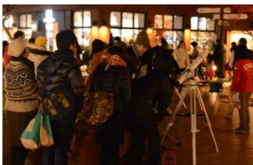
▲スターパーティのイメージ ※実際とは一部異なります。