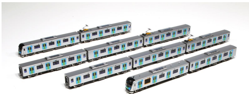
40000 系 N ゲージ鉄道模型