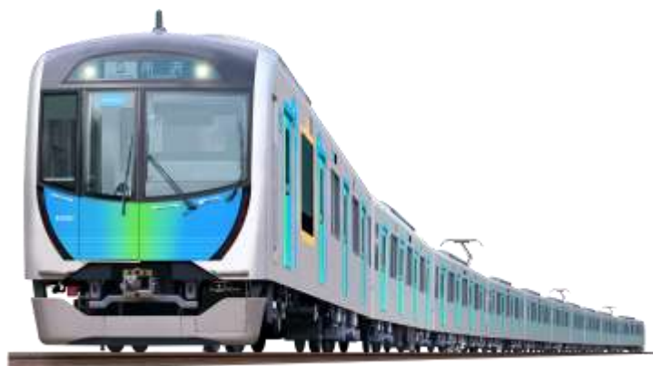
有料座席指定列車「S-TRAIN」