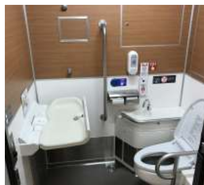
車内トイレ・おむつ交換シート