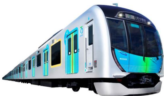
新型通勤車両「40000 系」外観