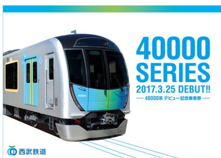
「40000 系デビュー記念乗車券」台紙