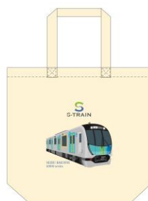
40000 系トートバッグイメージ