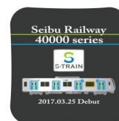
40000 系ネクタイピン&ピンバッジセットイメージ