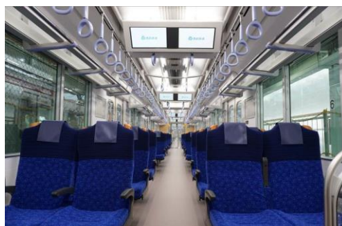
新型通勤車両「40000 系」内観（クロスシート）