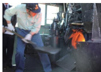
（左上）転車台 （左下）火室で石炭をくべる乗員