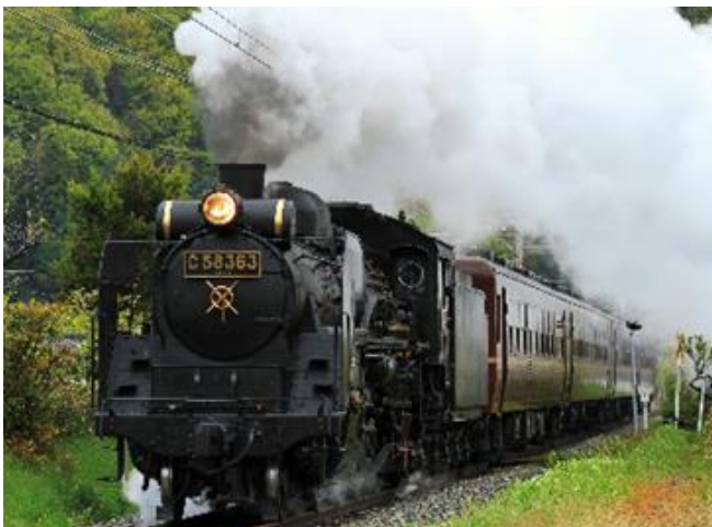
秩父鉄道 SL パレオエクスプレス（走行）