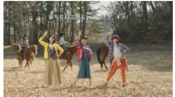
<アクティブ篇振り付けムービー>