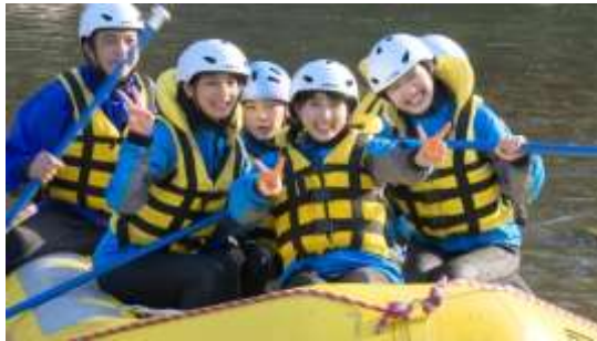
<アクティブ篇メイキングムービー>