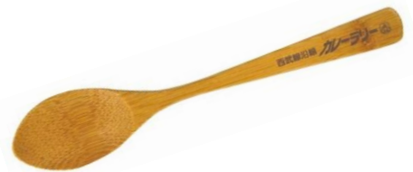
クリア賞：オリジナルスプーン