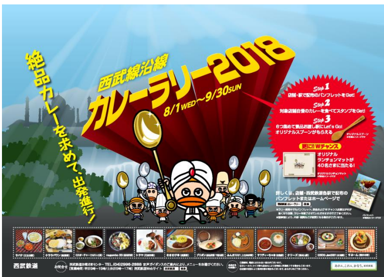
西武線沿線カレーラリー2018（中吊ポスター・デザイン）