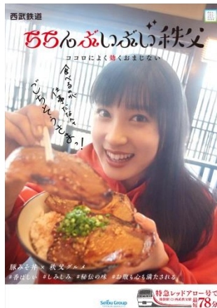
<豚みそ丼×秩父グルメ>