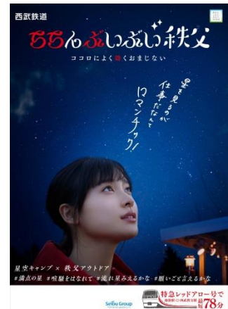
<星空キャンプ×秩父アウトドア>

西武鉄道株式会社（本社：埼玉県所沢市、社長：若林久）は、明日9月27日（木）より、秩父地域の魅力を発信する「2018年ちちんぶいぶい秩父」キャンペーンとして、テレビCM「ちちんぶいぶい2018年なごみ篇」の本格放映を開始、また西武鉄道CM特設Webサイト（ https://www.seiburailway.jp/railways/tvcm/ ）をリニューアルします。今回も秩父の魅力を楽しいダンスで表現。特設WebサイトではテレビCM映像だけでなく、気になるメイキング映像や、土屋太鳳さんが踊るダンスの振付動画、ロケ地情報などを公開します。また、撮影中のひとコマを切り取ったポスターは、10月より西武線駅構内などに掲出します。