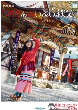
B1ポスター <寶登山神社×秩父パワースポット>