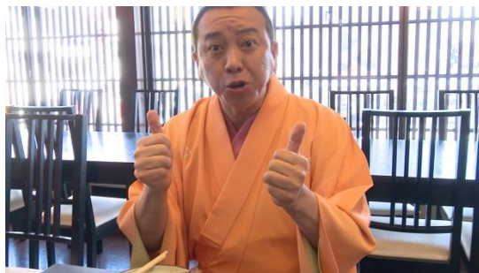
<なごみ篇メイキングムービー>