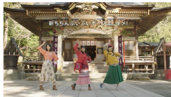
<なごみ篇振り付けムービー>