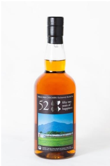
イチローズ・モルト「52席の至福」 プライベートボトル 2018