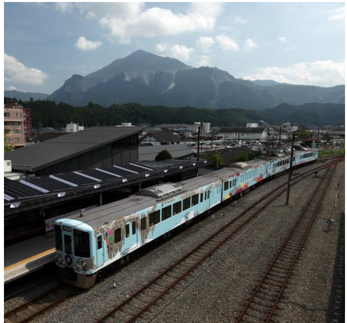
秩父市と横瀬町の境界にある、秩父地域を代表する ランドマーク「武甲山」をバックに走る 西武 旅するレストラン「52席の至福」