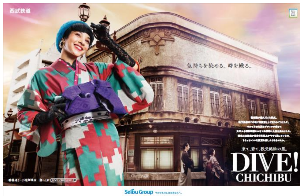
DIVE! CHICHIBU～秩父銘仙篇～ポスター