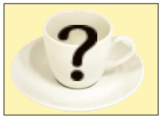
左：＜秋編景品＞デザートスプーンセット